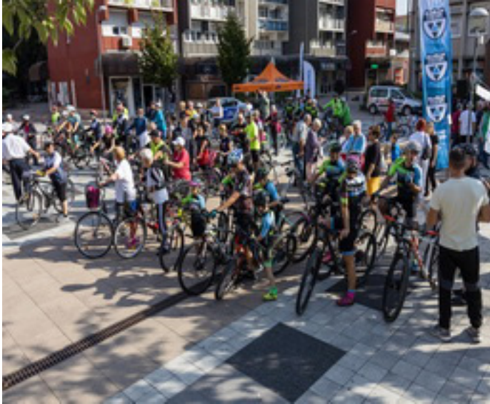
Vidovicsné Bene Erzsébet: Indul a Tour!