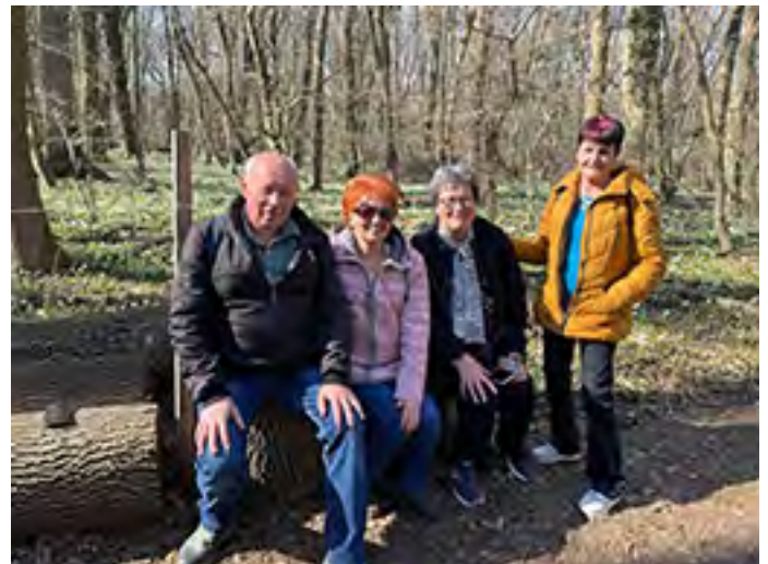
Jó itt pihenni