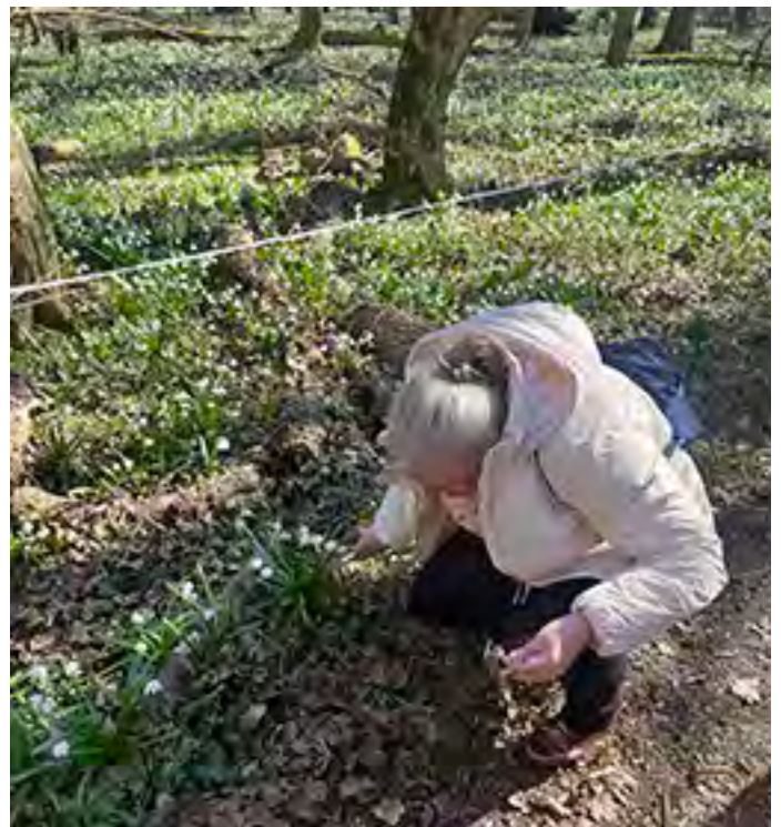
Az illata is csodás