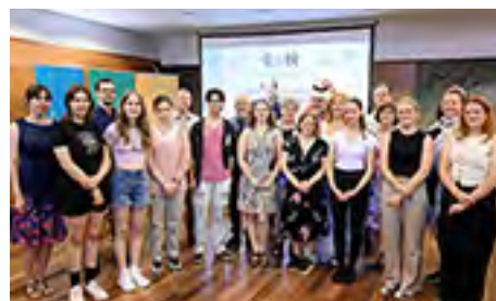
A Richter TETT mese- és történetíró pályázat nyertesei: az 1., 2., 3. korcsoport alkotói